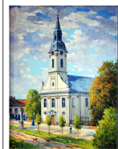
Die Kath. Kirche in Kernei - erbaut von 1791-1797