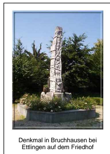
Denkmal in Bruchhausen bei Ettlingen auf dem Friedhof